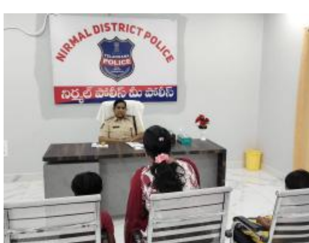
పరిష్కారం అయ్యాయని మరియు పెండింగ్ పిర్యాదుల పురోగతిని గురించి అధికారులను అడిగి తెలుసు కున్నారు.

భారత శక్తి ఉమ్మడి అదిలాబాద్ జిల్లా బ్యూరో, జూలై 02: నిర్మల్ జిల్లా బుధవారం ఖైంసా ఎస్పీ క్యాంప్ కార్యాలయంలో నిర్వహించిన గ్రీవెన్స్ డే కార్యక్రమానికి ఖైంసా సబ్ డివిజన్ పరిధిలోని వివిధ ప్రాంతాల నుండి వచ్చిన అర్హులను నుండి ఫిర్యాదులు స్వీకరించి వెంటనే పిర్యాదు దారుల ముందే సంబంధిత పోలీస్ స్టేషన్ల అధికారులకు ఫోన్ ద్వారా బాధితులకు చట్టపరంగా అందాల్సిన సహాయాన్ని అందిస్తూ వారి సమస్యలను పరిష్కరించాలని జిల్లా ఎస్పీ ఆదేశించారు. పి టీమ్ సిబ్బంది తో క్యాన్సి కుటుంబ కలహాల కేసులలో ఇరు పార్టీ వారికి కౌన్సెలింగ్ ఇవ్వటం జరిగింది. ఇలా ఖైంసా లో పి టీమ్ సిబ్బంది ద్వారా కౌన్సెలింగ్ తో కుటుంబాలు నిలబడుతున్నాయని, మేము నిర్మల్ రావటానికి కష్టంగా ఉండటాన్ని ఎస్పీ గారు అర్థం చేసుకుని ఖైంసా లో కౌన్సెలింగ్ ఇవ్వటం గురించి పిర్యాదు దారులు చాలా సంతోషం వ్యక్తం చేస్తున్నారు. గ్రీవెన్స్ లో వచ్చిన ఫిర్యాదులను ఇప్పటి వరకు ఎన్ని